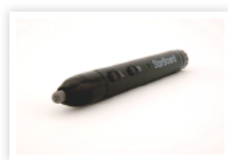
Penna elettronica (opzionale)